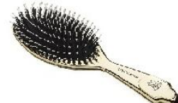
Une brosse à cheveux.