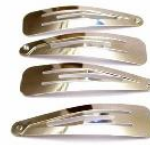
Des barrettes de même couleur que les épingles.