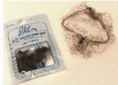
Filets à chignon fins de la couleur des cheveux de votre fille.